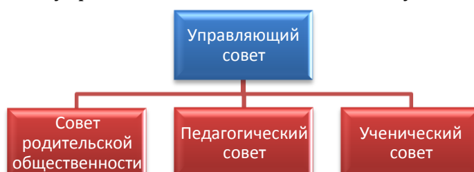
Схема самоуправления школы выглядит следующим образом:

Родители активно участвуют в деятельности школы, оказывают помощь в ремонте кабинетов, улучшении материально-технической базы школы.