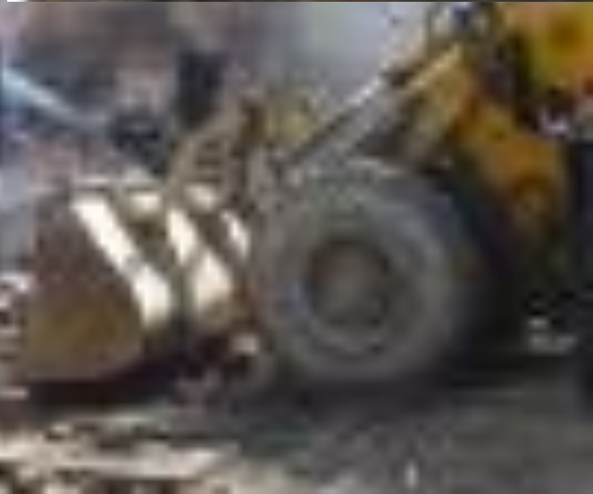
Беслан. Сентябрь 2004 г.